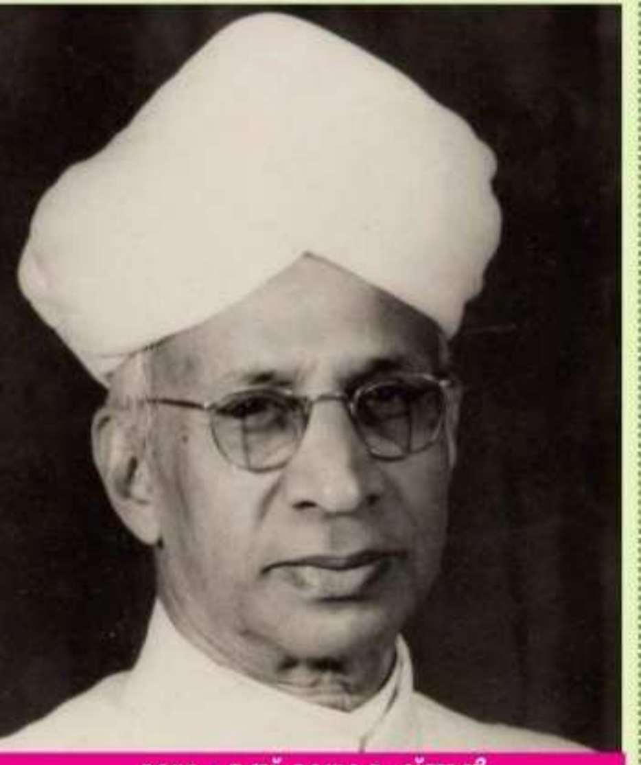
ഡോ. എസ്. രാധാകൃഷ്ണൻ